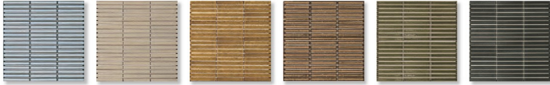
IP-501G (ボーダー) IP-502G (ボーダー) IP-503G (ボーダー) IP-504G (ボーダー) IP-505G (ボーダー) IP-506G (ボーダー)