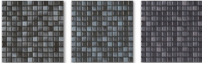
B5-01 B5-02 B5-03