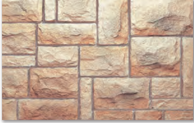
CF-18 チェリーブラウン