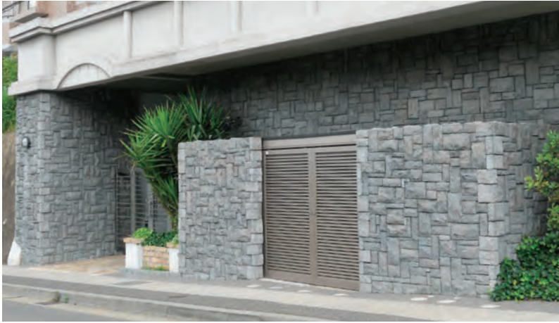
■材質:軽量骨材セメント ■Made in China