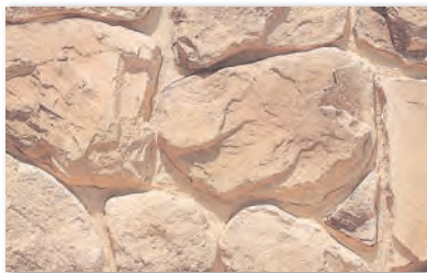
MS-71 サンライズイエロー