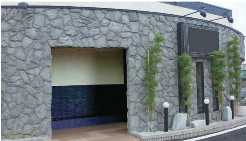
■材質:軽量骨材セメント ■Made in China