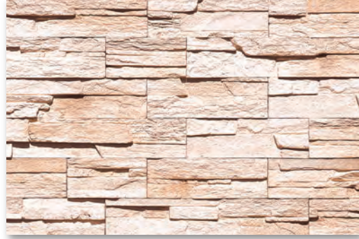
SLS-130 スプリングベージュ