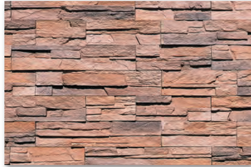
SLS-420 オールドブラウン