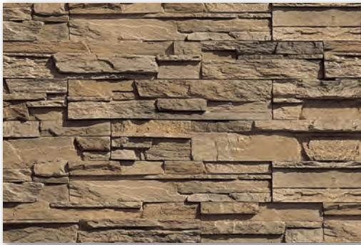
SLS-450 チャコールブラウン