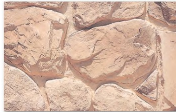
MS-71 サンライズイエロー