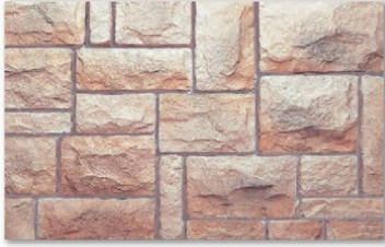
CF-18 チェリーブラウン