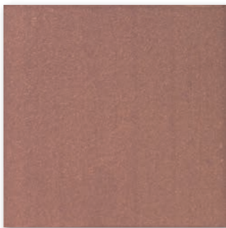
SA- /RY (焼き過ぎ特有の色幅があります。)

150角平 SA-150/BL 150×150mm 20mm厚 42枚/㎡ 16枚/ケース・13kg 18,000円/㎡