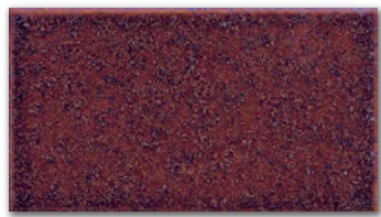
△ST-308S(あめ砂入り) 小口平のみ