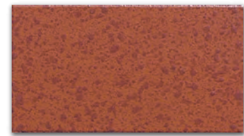
ST-325S(レンガ) 小口平のみ