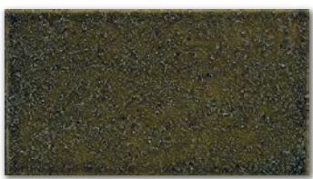
△ST-309S(オリベ砂入り) 小口平のみ