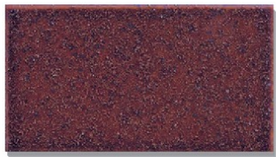
ΔST-308S(あめ砂入り) 小口平のみ