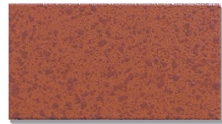
ST-325S(レンガ) 小口平のみ