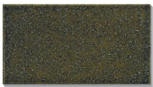
ΔST-309S(オリベ砂入り) 小口平のみ