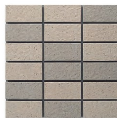
EP-02AB A(3.5YR 6.3/2.0) B(2.5YR 5.7/1.7)