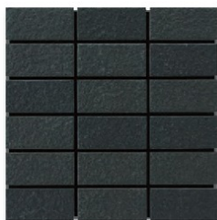
※EP-96 (単色) A(5.6P 3.0/0.2)