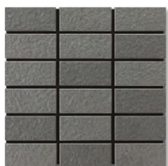
※EP-84AB A(4.9R 4.0/0.1) B(4.0RP 3.7/0.2)