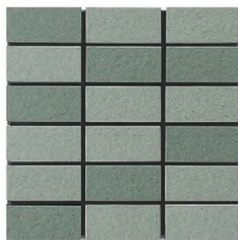
EP-56AB A(5.2GY 5.2/1.1) B(6.3GY 4.6/1.0)