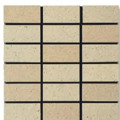
※EP-51AB A(7.6YR 7.6/3.4) B(7.3YR 7.1/3.9)