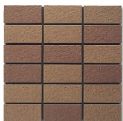
※EP-03AB A(0.7YR 5.0/4.1) B(9.6R 4.7/3.9)