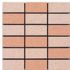
EP-82AB A(6.6YR 6.7/2.8) B(6.0YR 6.1/4.0)