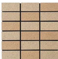
EP-52AB A(5.6YR 6.6/3.1) B(4.8YR 6.1/3.7)