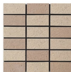
EP-54AB A(3.5YR 6.2/3.0) B(2.5YR 5.7/2.9)