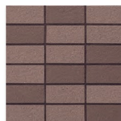
EP-06AB A(1.4YR 5.0/2.2) B(0.2YR 4.4/1.9)