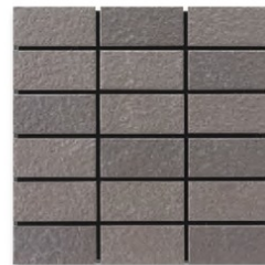
EP-83AB A(5.7YR 4.0/0.5) B(2.8YR 3.7/0.4)