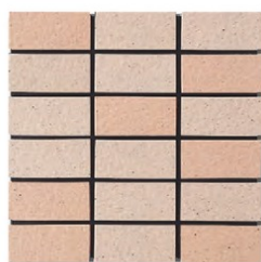
EP-53AB A(3.6YR 6.2/3.1) B(3YR 6.2/3.5)