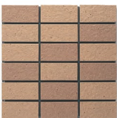
※EP-04AB A(4.3YR 5.9/3.6) B(3.3YR 5.4/3.6)