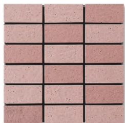
※EP-55AB A(9.9R 6.2/3.0) B(9.7R 5.9/3.1)