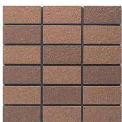
※EP-05AB A(3.1YR 5.1/3.2) B(1.9YR 4.5/2.9)