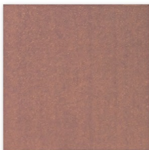
SA- /RY (焼き過ぎ特有の色幅があります。)

150角平 SA-150/BL 150×150mm 20mm厚 42枚/㎡ 16枚/ケース・13kg 17,000円/㎡