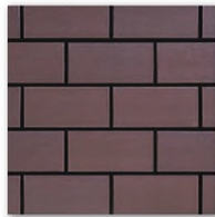
A-210 A-190 ☒