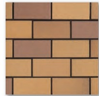
※NF-210 ※NF-190 ☒