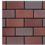
※RF-210 ※RF-190 ☒