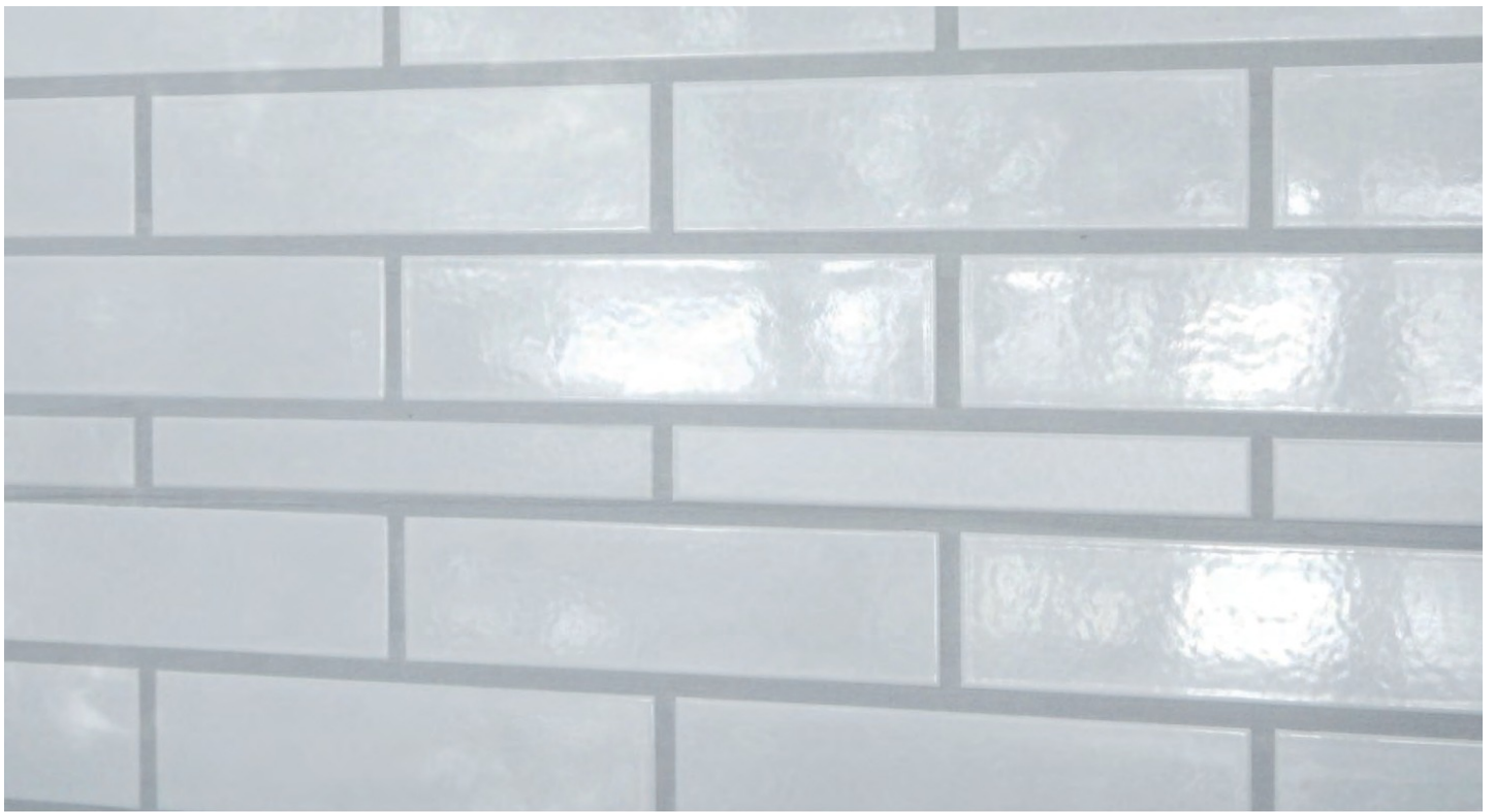
TI-110二丁掛とTI-10ボーダー